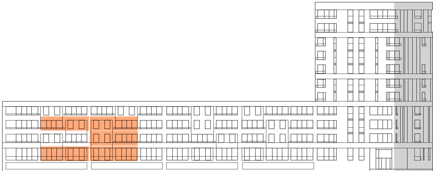
GEZIEN VAN PARKZIJDE