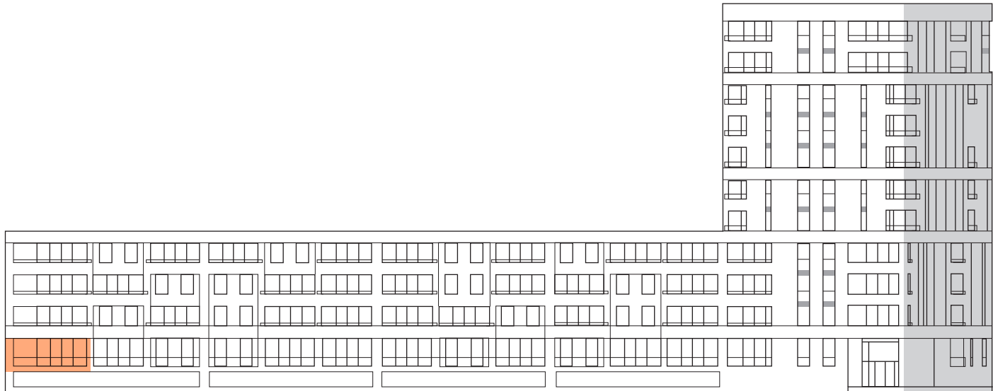
GEZIEN VAN PARKZIJDE